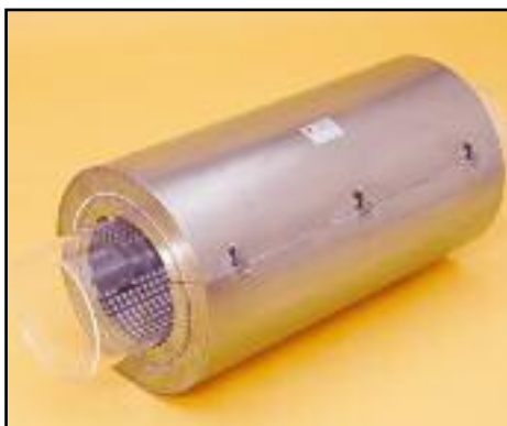
Z69 involucro coibente