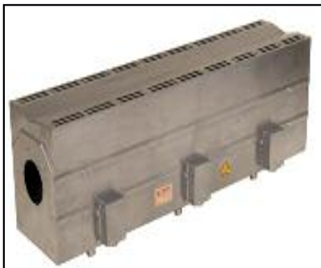
Involucro a forma rettangolare con morsettiere incorporate