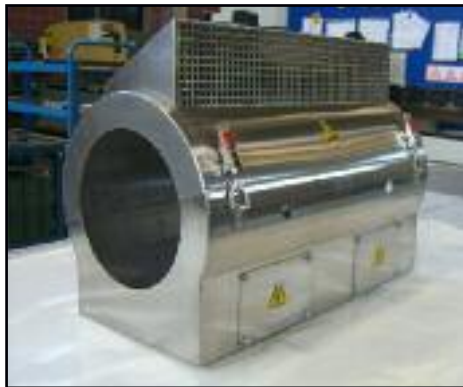
Esecuzione con saldatura a TIG