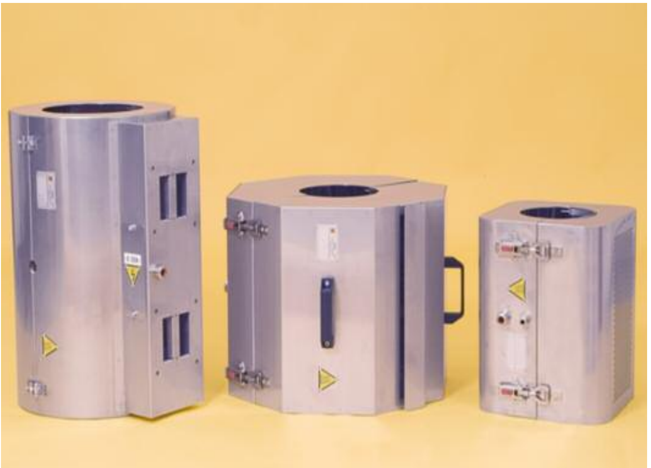
MODELLO Z.69 (ISOAIR)